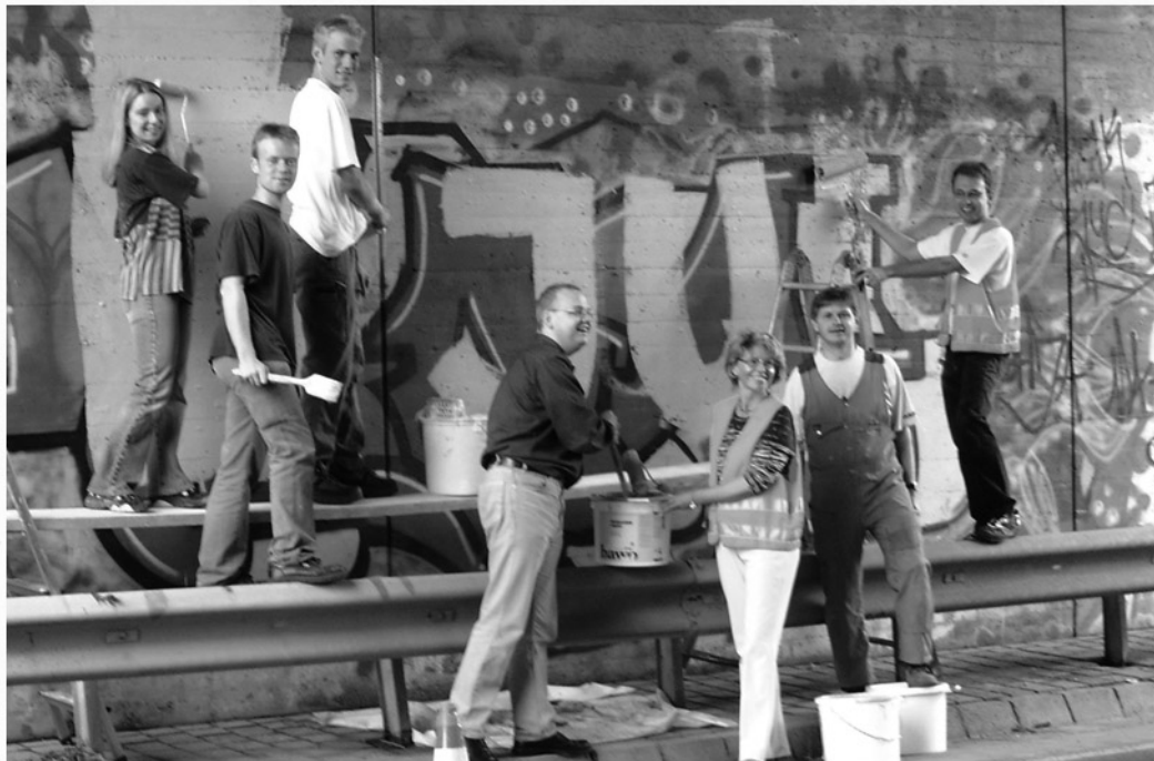
Nach einer Grundreinigung übermalen die JU-Aktivistinnen die wilden Graffiti-Schmierereien mit frischer Farbe, die die Straßenmeisterei zur Verfügung gestellt hatte.